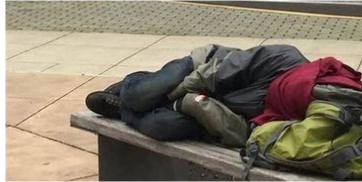
Hulp aan daklozen buiten het Sorgcentrum