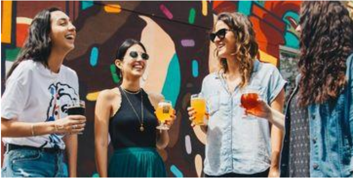
Huis Veronica voor meiden 15-21 jaar