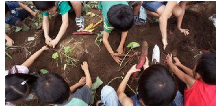
Huis Filip 15-21 jaar