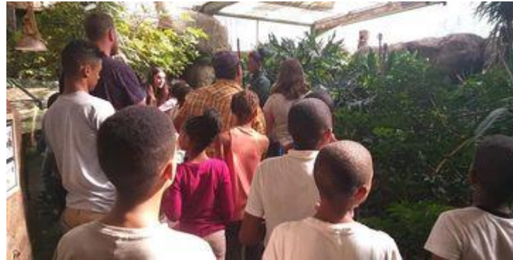
Huis Luigi 6-14 jaar