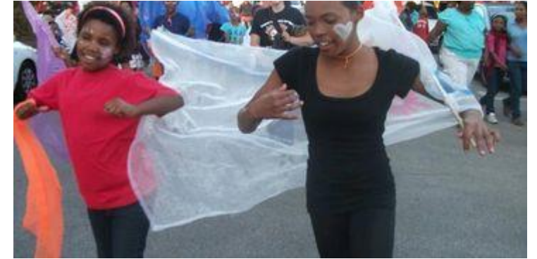
Bijdragen aan culturele activiteiten