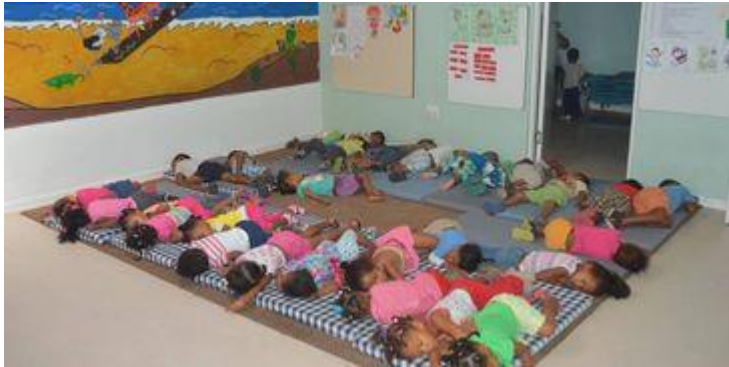
Huis Bethanië 2-5 jaar